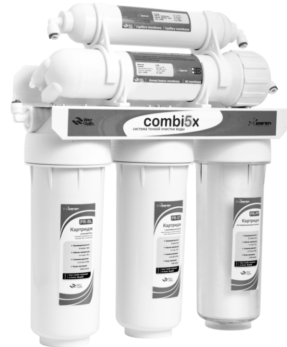
СХЕМА ДЛЯ ПОДКЛЮЧЕНИЯ системы для очистки питьевой воды